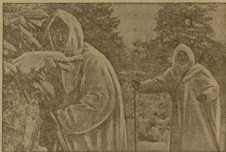
Боевая учеба в Красной Армии. НА СНИМКЕ: В лыжной разведке (Н-ская часть Ленинградского военного округа).

100 сотрудников управления пароходства и членов их семей посетили кинотеатр „Глобус“. Фильм смотрели моряки пароходов „Ола“, „Амур“ и других судов.