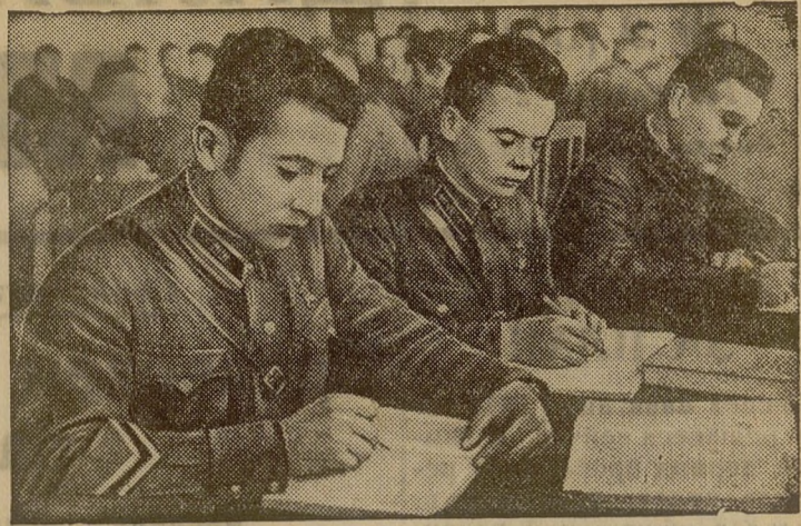
При воронежском Доме Красной Армии имени Ворошилова организован университет выходного дня. НА СНИМКЕ: Слушатели факультета истории ВКП(б) на занятиях.