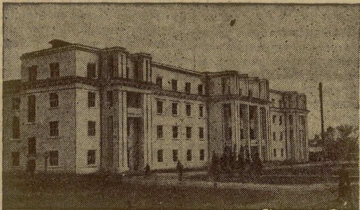
Дом Советов в гор. Ойрот-Туна (Ойротская автономная область).