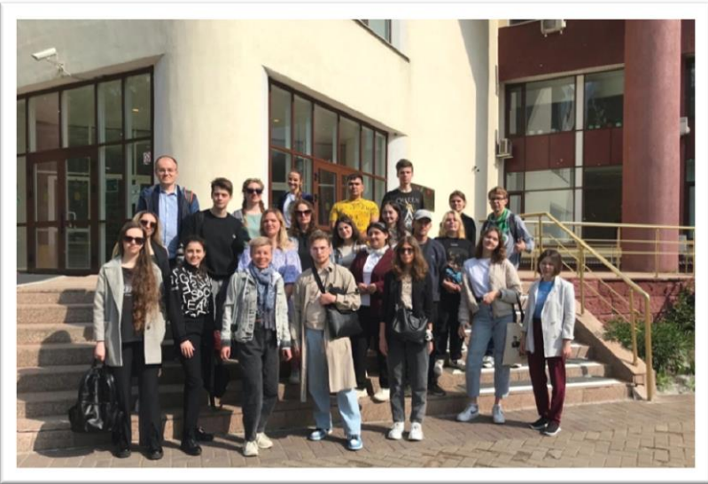
Фестиваль по поэзии новых литературных форматов «Молодой Пушкин»